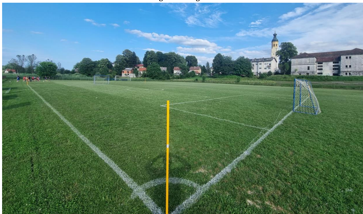
Slika 1. Nogometno igralište Plaški

Općina Plaški nije iskazala vrijednost nogometnog igrališta u knjigovodstvenim evidencijama zbog neriješenih imovinskopravnih odnosa.